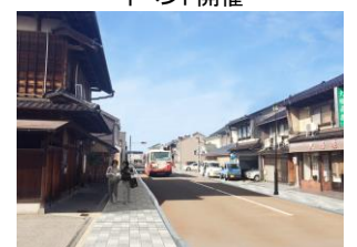
無電柱化によるまちなみ整備