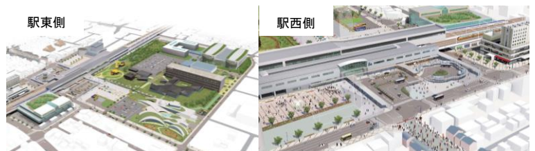
小松駅周辺整備イメージ

まちなかの環境整備の進捗に合わせ、小松うどんなど新たに「食」を取り入れた試みや、町家保全に関する活動、チャレンジショップ、イベント開催など、中心市街地の活性化や賑わい創出に向けた市民活動が活発になりました。また、こまつアズスクエアでの大学開学を契機として、大学と地域との密接な連携により人材育成・イノベーション創出・産業発展・医療向上・国際化など地域振興と社会の健全な発展に資する「地域連携事業」や、生涯学習環境の充実により世代・立場・組織を超えて地域で活躍する人材育成拠点（学びの場）となる「こまつ市民大学」が開始され、多くの市民の交流に寄与しています。