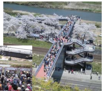
船岡城址公園と白石川堤の一目千本桜の回遊性が向上