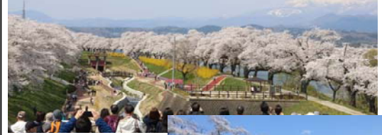
「日本さくら名所 100 選」の地に新たな回遊拠点