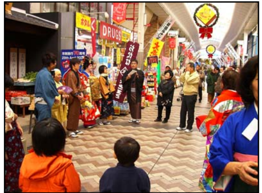
↑商店街での池田タウンインフォメーション開設の様