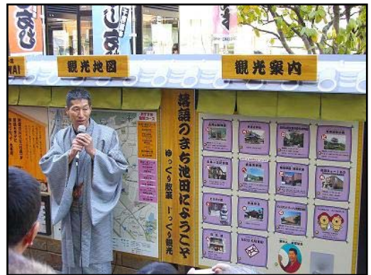
↑池田駅前で落語にちなんだ逸品を扱っているお店を紹介する案内板