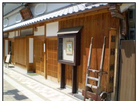
↑まちなみ保存と併せて設置したまちかどギャラリー（絵画や写真などを掲示します）