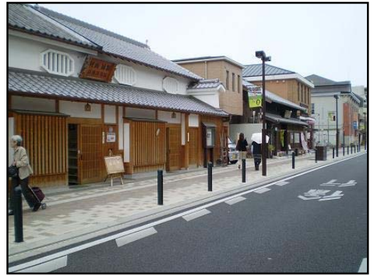
↑街路整備した沿道にある、昔の町並みを再現した建築物

また、健康増進や保健、福祉サービス、子育て支援や地域福祉を推進する交流の拠点とした「保健福祉総合センター」も開設いたしました。こういった取組みなどを幅広く発信できることは、さまざまな方が池田市に足を運んでいただける事につながり、池田市の街の活性化につながると確信しております。