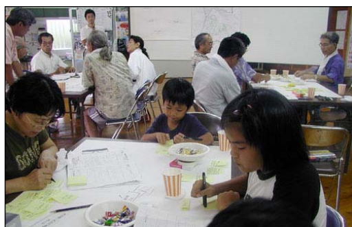
▲仲間地区のまちづくりワークショップ