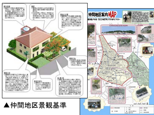
▲仲間地区景観基準