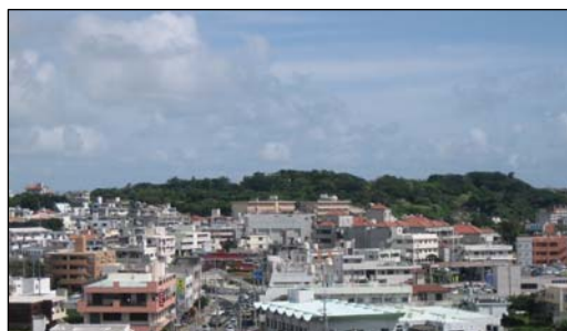
▲浦添グスクの丘陵地帯を背景にみる仲間地区

沖縄はかつて琉球王国という独立国家でした。その琉球王国は、今から 600 年あまり前にこの浦添の地で誕生したと言われています。ところが貴重な文化財が前大戦で壊滅的に破壊され、現在その復元が進んでいます。今回、ウォークラリーなどを開催し市民(他市町村からの参加者も多い)から好評を得ており、将来は次代を担う子供達の育成に繋がりたい。