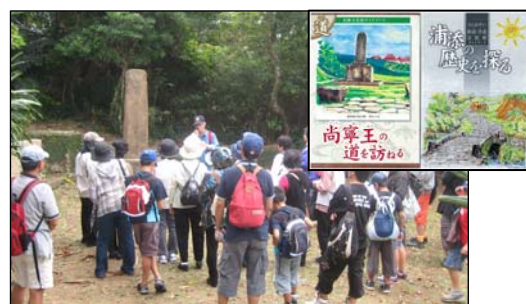
▲歴史ウォークラリー、上：NPO 作成のパンフ