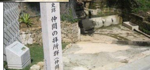
▲復元された仲間樋川、上：樋（とい）部分