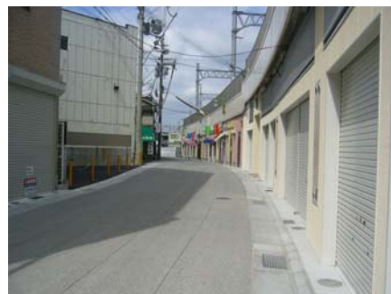
▲山陽電鉄（姫路駅付近）側道整備事業

ついては、平成の築城を心から祝えるまちづくりが成就するよう、微力ではありますが尽力していることが「まちづくり効果賞」の受賞へつながったのだと、地元としても大変喜んでおります。