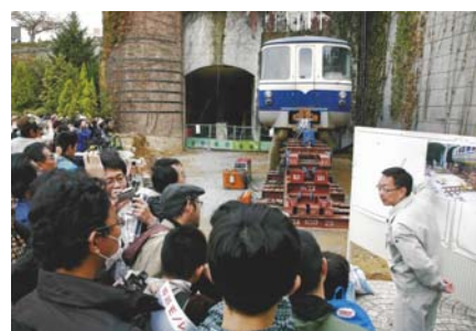
▲手柄山モノレール公開事業