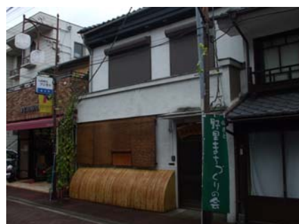
▲姫路城周辺の町家等保存・活用支援事業