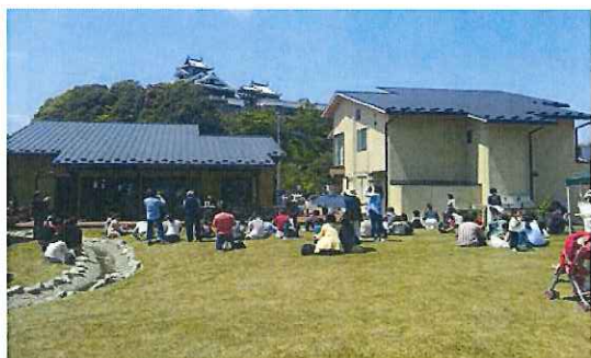
《福知山城憩いの広場“ゆらのガーデン”：福知山城周辺の賑わいの創出を図るために整備》