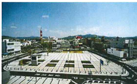
《駅北口公園：イベントの開催など、多目的に利用できるよう整備》