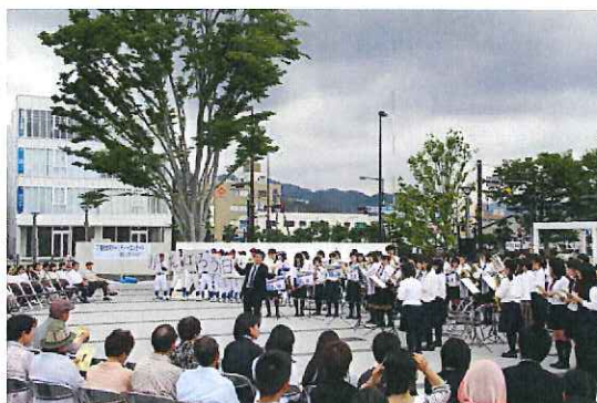
《駅北口公園で開催された高校生たちによる東日本大震災チャリティーコンサートの様子》