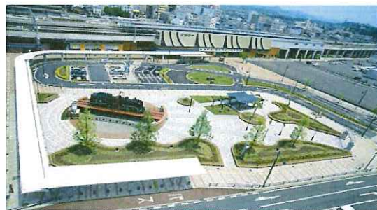
《駅南口公園：中央に鉄道の町のシンボルとして本物のS L機関車を設置、個性ある公園として整備》

福知山駅前商店街振興組合では、イメージキャラクターの製作、シンボルステッカーの作成、また整備されたコミュニティ道路を利用したフリーマーケットの開催など、個性ある商店街としての取り組みを行っています。福知山駅周辺では都市施設及び都市基盤が整備されたことから、大型店舗の進出もあり、集客数は確実に増加しており、昔のような賑わいが戻りつつあります。これからも、市と協働しながら、商店街の振興、市街地の活性化に向けた取り組みを続けていきたいと思っています。