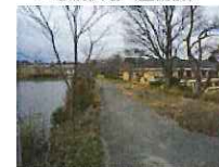
▲水辺遊歩道（整備前）