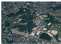
▲あやめ池遊園地時代

2004年6月に閉園したあやめ池遊園地跡地の開発に際し、地元住民の方々と奈良市、近鉄、学識経験者で構成される検討会を設置して、産・官・学・民が力を合せてまちづくりの方向性を検討しました。そこでは、奈良県を中心に近畿一円の子供の記憶に残るあやめ池の風景（ランドスケープ）を継承、活用して四季や自然と応答する街とともに新たなライフスタイルのもとに人と地域がつながるまちづくりを目指すという方向性を示しました。この方向性を反映し、あやめ池周辺の四季折々の自然を親しむための遊歩道の設置とともに巨樹や古木の保全や景観に配慮したまちづくりを推進するためのガイドラインの策定、さらには、環境共生住宅の導入とともにタウンセキュリティへの取り組みなど、関西圏で有数の生活環境と評される原動力になったものと考えています。このたびは「まちづくり効果賞」を受賞され、検討会会長として大いに誇りに感じるとともに、地域との連携の中で、今後さらなる発展を期待しています。