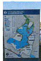
▲水辺遊歩道 休憩場所や距離等を表示