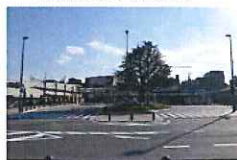
▲広々とした駅前広場