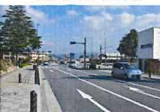
▲広々とした都市計画道路