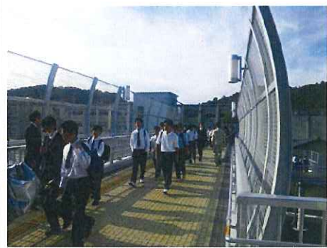
▲藤川駅跨線橋整備

今般の整備を機に、次世代を担う子ども達や地域住民の郷土に対する誇りや愛着を育むよう、活動を続けていきたい。