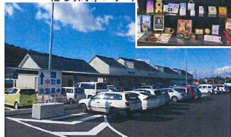
▲道の駅地域振興施設