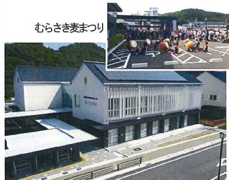
▲東部地域交流センター