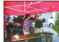
○景観ルール作り勉強会