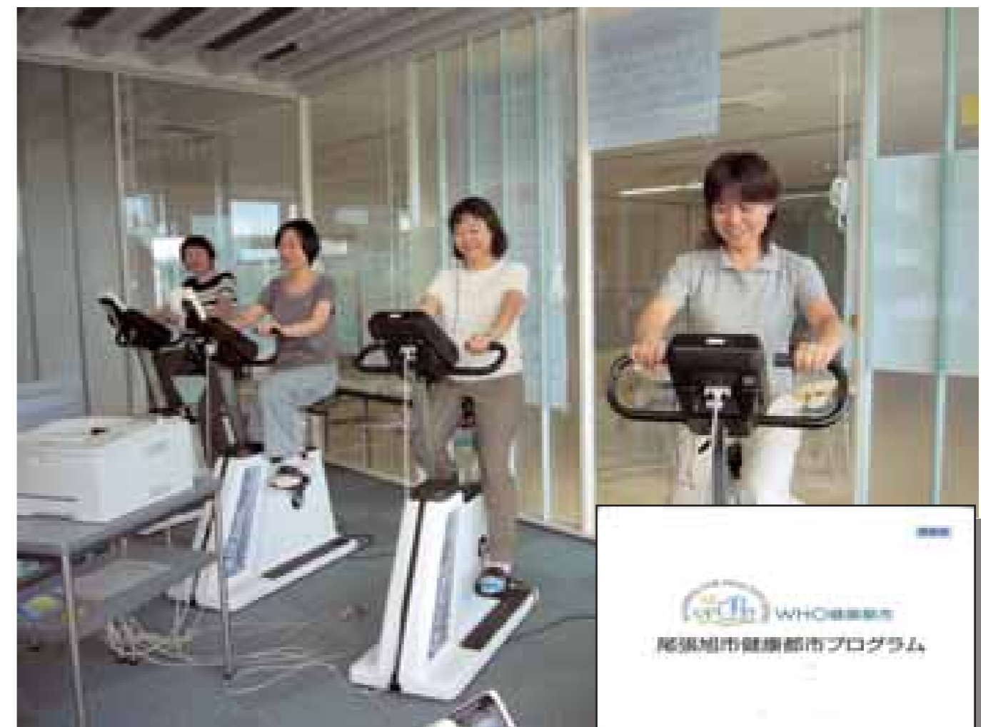
元気まる測定（WHO関連健康推進事業）

尾張旭市は平成16年6月に「WHO（世界保健機関）世界健康都市連合」の設立メンバーとして加盟し、「健康」を本市の「ブランド」として確立しようとしております。その「ブランド」を確立するために都市再生整備計画では、市民がいつまでも元気でいられるような「体」と「心」、それを取り巻く「社会」的環境を総合的に整備してまいりました。本計画により芽生え始めた市民の健康への意識をさらに広げ、市民と行政が協働して「健康の花が咲き誇る 尾張旭」を実現させていきたいと思っております。