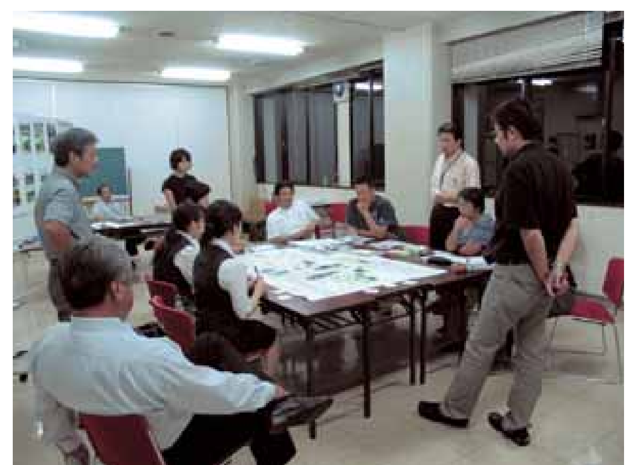
▲学び実践塾開催の様子（ワークショップ形式での検討