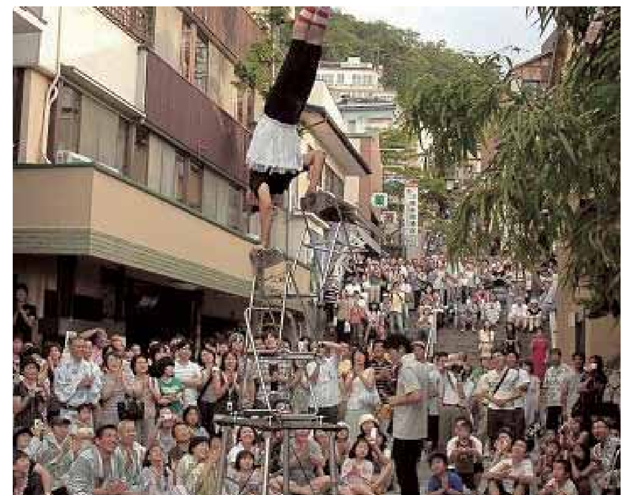
▲伊香保温泉の顔、石段街で行われた大道芸