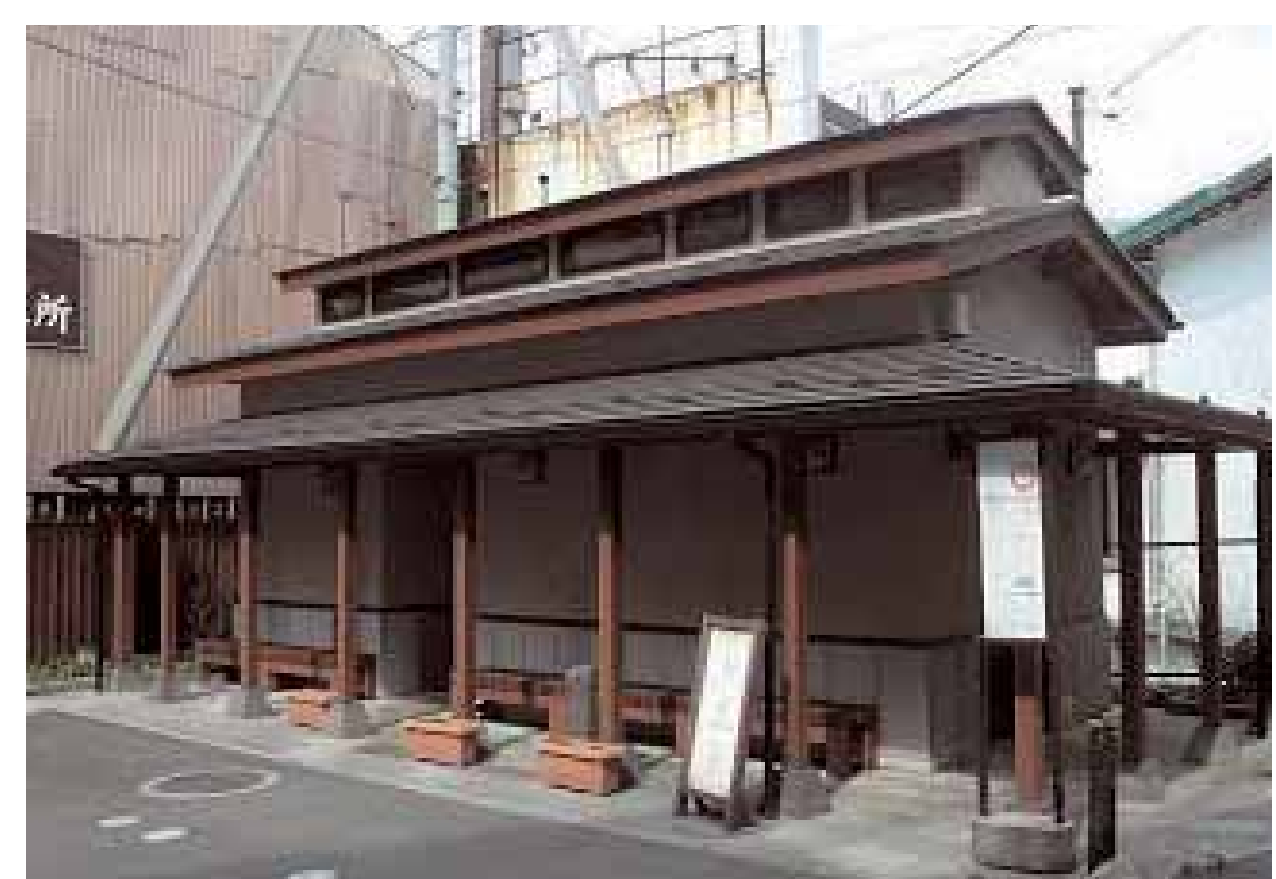
▲休憩スペースも兼ね備えたトイレ