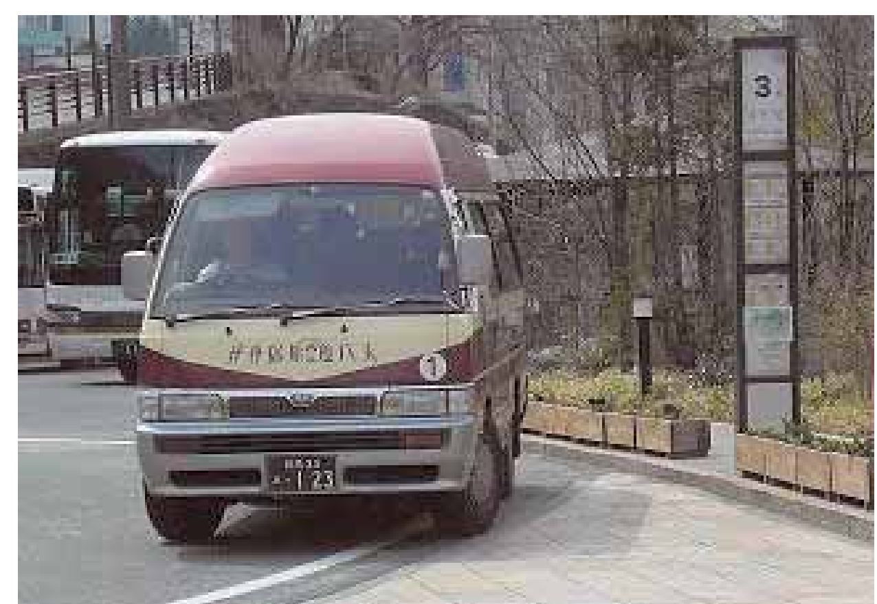
▲調査後、本格運用している伊香保タウンバス