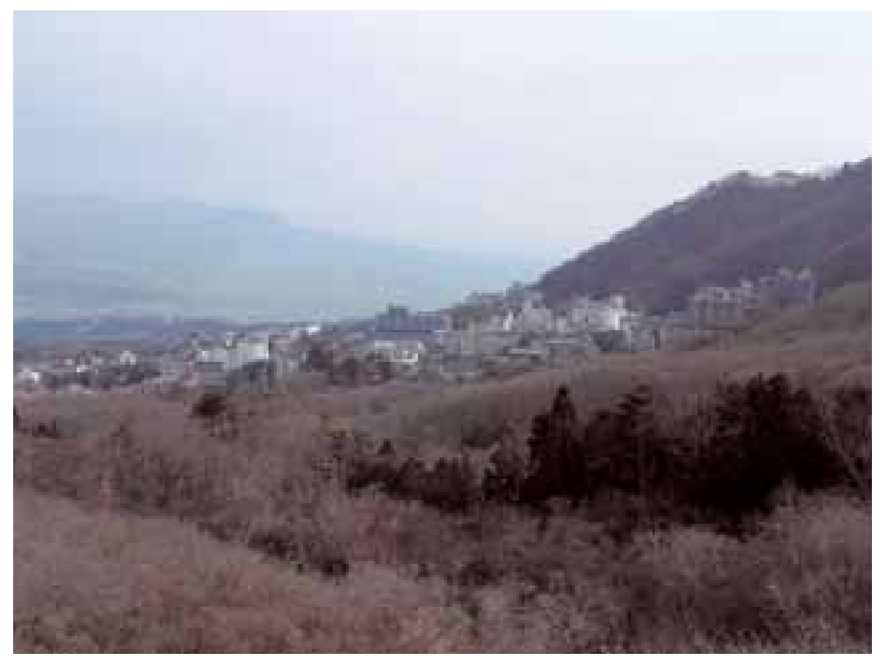
▲伊香保温泉の全景

「第 3 回まち交大賞」において、プロセス賞を受賞したことは大変名誉なことと感じております。文学の小径地区のある伊香保温泉は市の観光産業の中核を担っており、市の総合計画においても重点プロジェクトに位置付けております。こうした中でのプロセス賞の受賞は、今後の事業推進にあたり、とても励みになるものと考えております。これは、地域の皆様と一緒に進めてきた結果であり、今後も引き続き、再生への努力と活性化に向けての施策を展開していきたいと思っております。