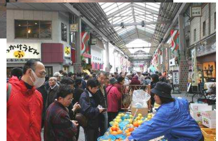
くらしき朝市三斎市開催風景