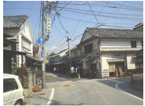
電柱、電線類が輻輳する倉敷美観地区

倉敷駅周辺地区は、全国的に知名度の高い倉敷美観地区を有しているが、伝統的な建造物と調和した都市空間は確保されていない。また密集市街地を多く抱え、高齢化、空洞化により宅地更新もままならず、人口は減少し、空家、空店舗、低未利用地が増加しているため活力低下が著しい。これらを要因とする危機感により協働のまちづくりへの機運が盛り上がりつつあるが、実践にまでは至っていない。このため、観光資産の再構築、市街地の活性化、協働のまちづくりが求められている。