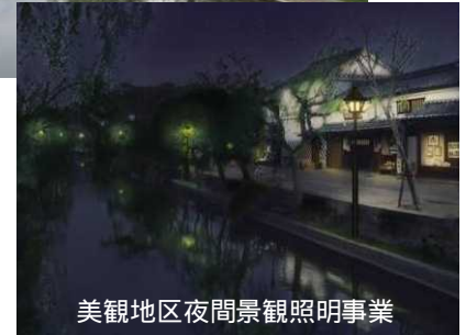
美観地区夜間景観照明事業